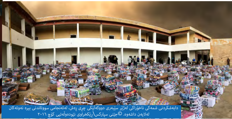
دابەشکردنی شەمەکی ناخۆراکی لەژێر سێبەری دووگەلێکی چەری ڕەش، لە ئەنجامی سووتاندنی بیرە نەوتەکان لەلایەن داعشەوە.