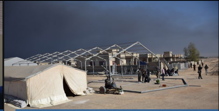
التقدم مستمر في موقع طوارئ مدرج القيادة الجوي؛ قاعات كبيرة تم نصبها (خيم كبيرة للإدارة و التسجيل) قد تم نصبها هذا الأسبوع.