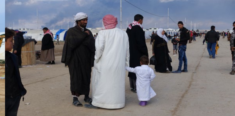
يعد موقع الطوارئ في قاعدة القيارة الآن موطن لأكثر من ٢,٦٩٧ عائلة عراقية نازحة (أكثر من ١٥,٩٠٠ شخص). هالة جابر / المنظمة الدولية للهجرة في العراق | كانون الثاني ٢٠١٧