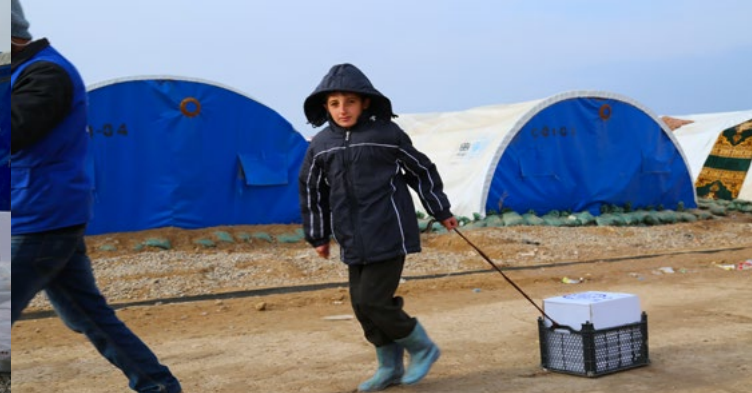
يسحب الطفل النازح طرد المواد الغير غذائية حيث أستامته عائلته من المنظمة الدولية للهجرة، موقع الطوارئ قاعدة القيارة، رابر عزيز/ المنظمة الدولية للهجرة في العراق | كانون الأول ٢٠١٦