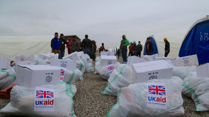
تلقي أبو حسين مجموعة المواد الغير غذائية لعائلته في مخيم حسن شام. كانون الأول ٢٠١٦