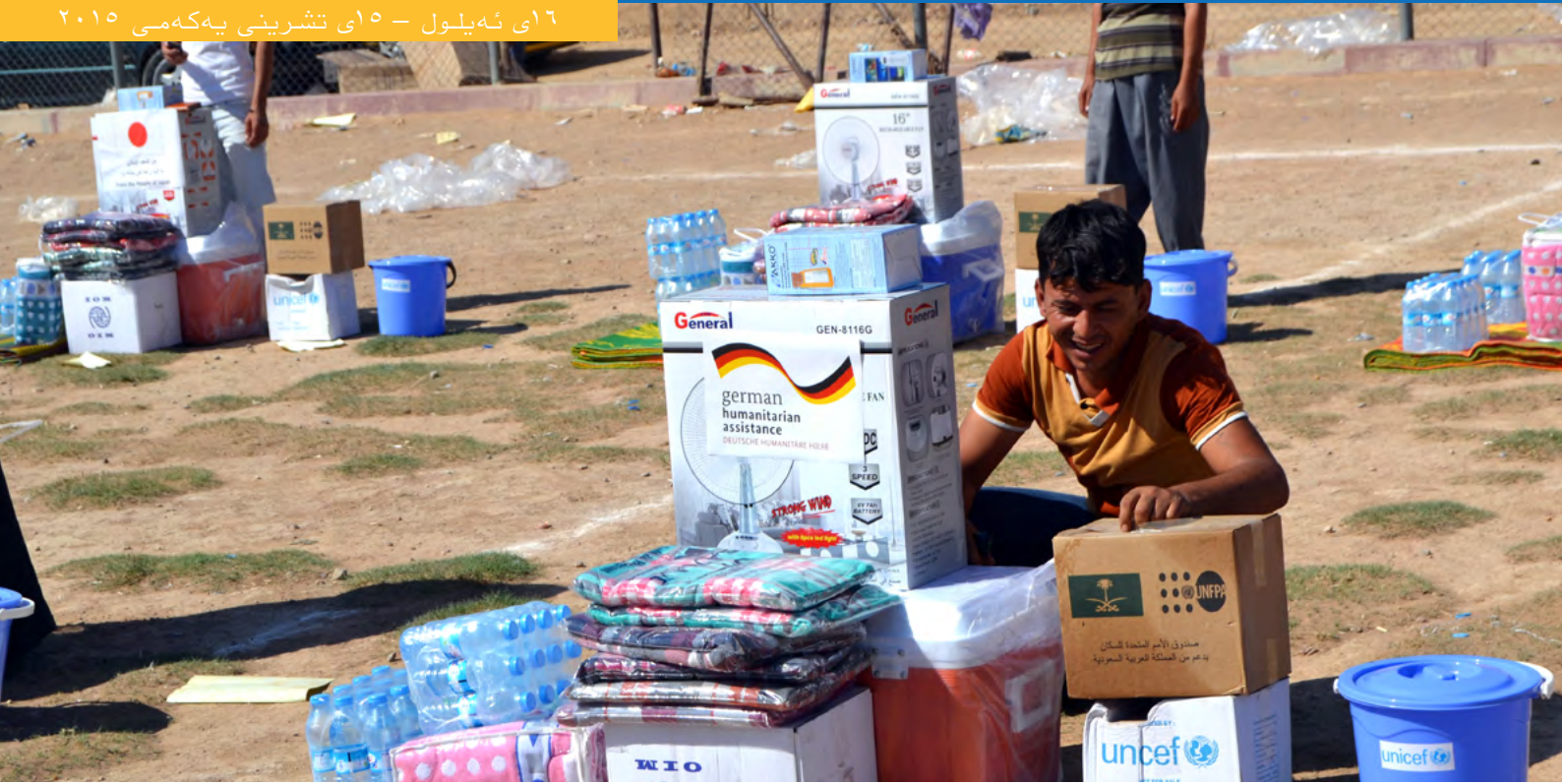
ئاوارهکان پێداویستی ناخوڕاکی له کهرکوک وهردهگرن/ ۲۱ ئهیلول